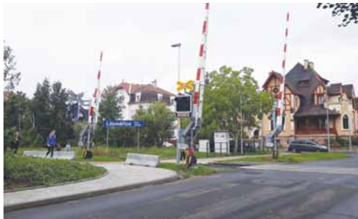
Nový chodník u přejezdu v ulici Osvobození.

Tímto krokem vznikla další komunikační osa, po které mohou lidé z ulice Nerudova bezpečně dojít až do Liberecké. Celkové úpravy by měly zvýšit bezpečnost i pro cesty vlakem a autobusem dojíždějících školáků do nedalekých škol. „V dlouhodobém plánu je protažení nového chodníku v Liberecké ulici až k nádraží včetně výstavby parkovacích míst, což ovšem bude ještě nějakou dobu trvat. Nejprve musíme vstoupit v jednání s majiteli pozemků a počkat na rekonstrukce