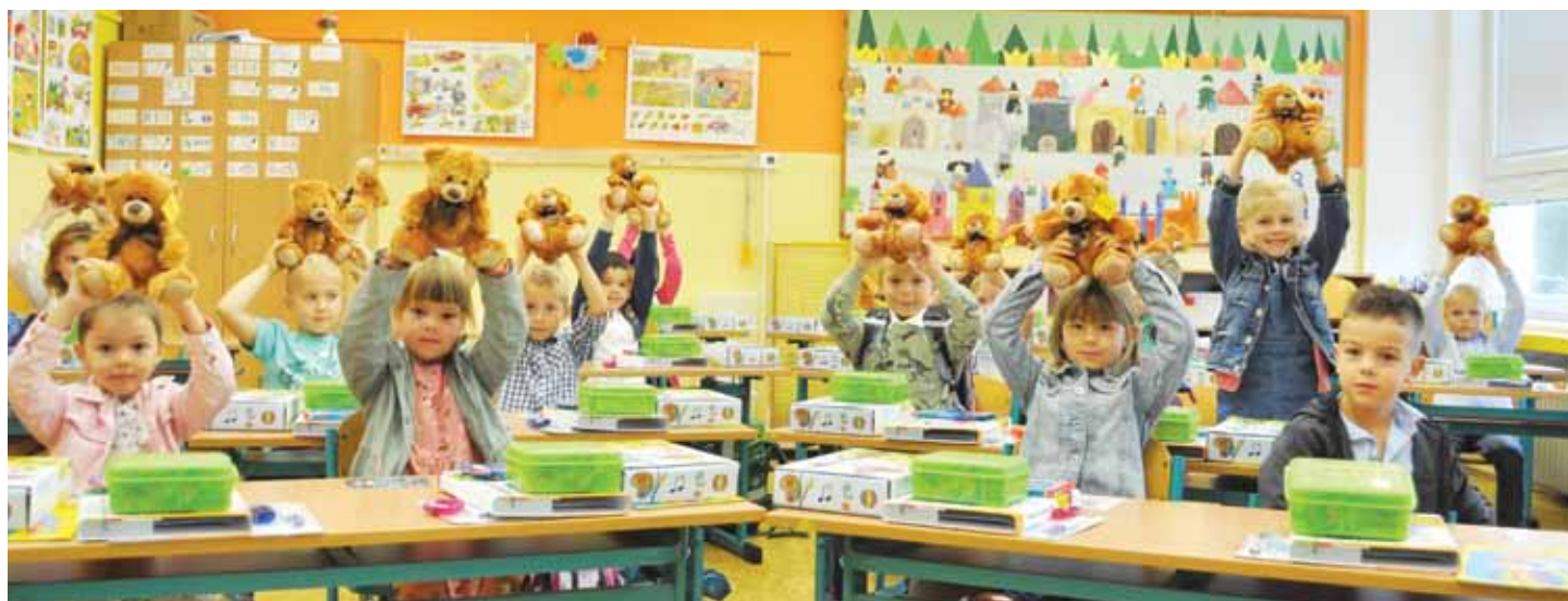
Do litoměřických základních škol nastoupilo 1. září více než 300 prvňáčků. V Základní škole U Stadionu dostali v první školní den několik dáreků. Kromě školních pomůcek také plyšové medvídky, jimiž se děti rády pochlubily.