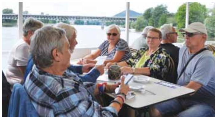
Odbor sociálních věcí a zdravotnictví připravil pro seniory tradiční plavbu po Labi. Byl o ni obrovský zájem.

„Naším hlavním cílem je seniory vzájemně propojit, aby spolu mohli navázat nová přátelství a zároveň se seznámili s činností organizací, které