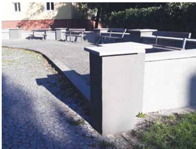
Revitalizovaný prostor u základní umělecké školy.

Ve druhém případě došlo k odstranění nevzhledné zdi s poničeným plotem u parkoviště v ulici Na Valech, poblíž průchodu do Velké Dominikánské. Zeď byla zcela nefunkční, toto místo hyzdila a stav zdiva i rezavého pletiva začínal být nebezpečný. Odstraněním se navíc více otevřel pohled na historické městské hradby. /tuc/