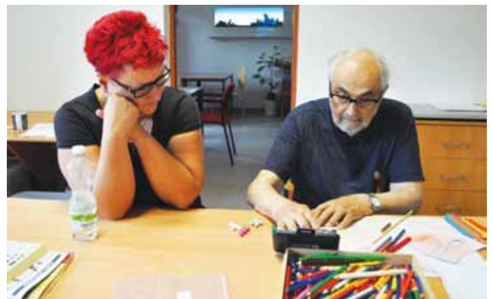
Klientům Sluníčka se při terapiích věnuje kvalifikovaný personál.

Mezi nejčastější problémy, se kterými se klienti Sluníčka potýkají,