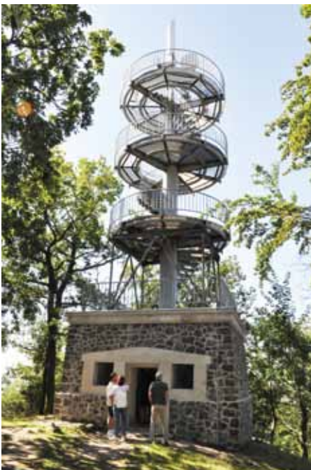
Na snímku dole vidíme, jak vypadala spodní část rozhledny ještě nedávno, a na horním jak vypadá v těchto dnech.

První rozhlednu na vrchu Varhošť ale postavili litoměřičtí turisté ze Spolku pro České středohoří už na konci 19. století. Dřevěná konstrukce sloužila do roku 1902. Nová rozhledna, už s kamenným základem a desetimetrovou dřevěnou konstrukcí, byla postavena v roce 1927. Na začátku 70. let bylo nutné ji kvůli havarijnímu stavu strhnout. Nynější rozhledna, jejíž ocelovou konstrukci na místo dopravil vrtulník a její ukotvení bylo velmi náročné, byla otevřena u příležitosti zahájení výstavy Zahradá Čech 22. září 1973. Vyhlička z rozhledny nabízí pohled do údolí Labe nebo na České středohoří a Krušné hory. Během sezony ji navštíví odhadem až pět set lidí týdně. Michaela Rozsypalová