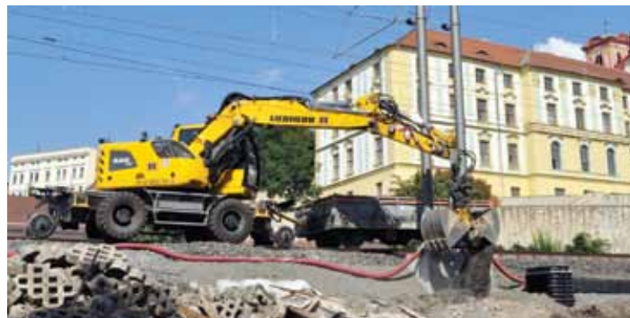
Práce na rekonstrukci trati zahrnou obnovu železničního svršku a instalaci nízké protihlukové stěny.

„Stavba v Litoměřicích zahrnuje zejména rekonstrukci železničního svršku a instalaci nízké protihlukové clony o délce téměř pět set metrů, dále renovaci tří mostů a jednoho propustku, obnovu stávajících opěrných zdí po obou stranách