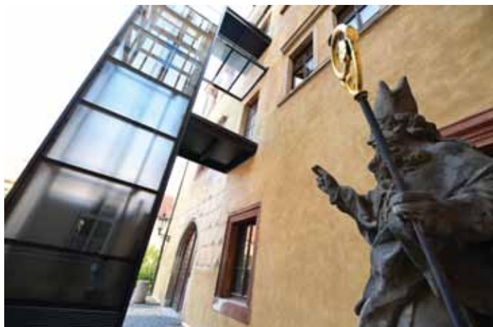
Nový výtah je situován ve dvoře radnice na Mírovém náměstí, výstavba trvala půl roku.