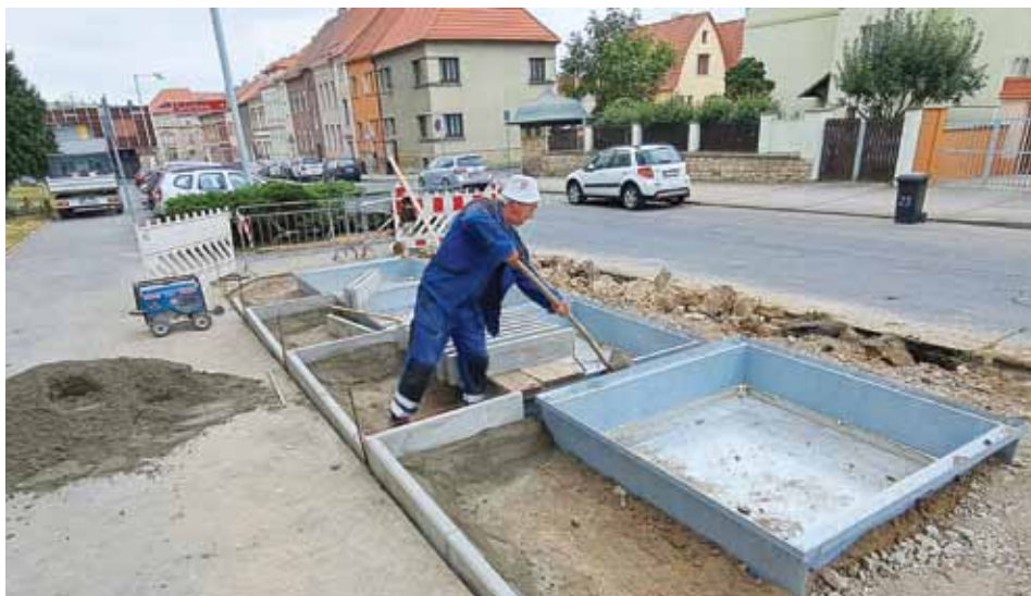
Další podzemní kontejnery budou ještě letos k dispozici na Mírovém náměstí a v Liškově ulici (viz snímek). Jejich výstavba již začala.

VK: Jedná se o zhruba 38 % vytřídkeného odpadu (papír, plast, sklo, kov, dřevo, textil, jedlé oleje a tuky). Předloni to bylo cca 33 %. Výpočet podílu vyseparovaného odpadu je stanoven vzorcem